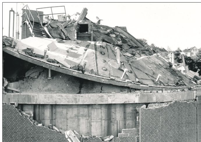
Det kollapsede betondæk lagde sig på rådnetankens topkegle. Under ringbjælken ses revne i tankvæggen.

Naturligt forekommende bakterier danner metan ved anaerob forrådnings af organisk materiale. Gassen kendes under flere navne: Sumpgas, lossepladsgas eller biogas. I mange år har det været almindeligt på renseanlæg at føre det producerede spildevandsslam til en rådnetank. Derved omsættes noget af det organiske materiale i spildevandsslammet til biogas, som typisk driver en gasmotor og generator. Den producerede elektricitet