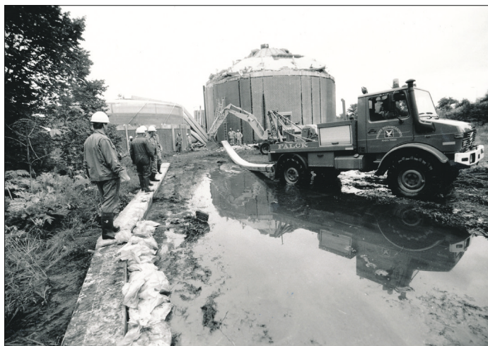
Sandsække forhindrede slammet i at løbe ned i den nærliggende bæk. Bemærk væltede betonpiller over anden tank.

En anden tankbil lastet med importeret hollandsk gylle var involveret i en noget mere harmløs ulykke på en gade i en forstad til Köln. Beboerne berettede, at en morgen, mens de spiste morgenmad, lød der pludseligt et brag ude på gaden, hvorefter stuen blev helt mørk. Det viste sig hurtigt, at der ikke var tale om en strømafbrydelse, men at vinduer og facader på gadens huse var blevet dækket med en såkaldt "brun klæbrig masse". Der er ingen grund til at gå i detaljer her, men årsagen var formentlig varmeudvikling og trykstigning i tankbilen.