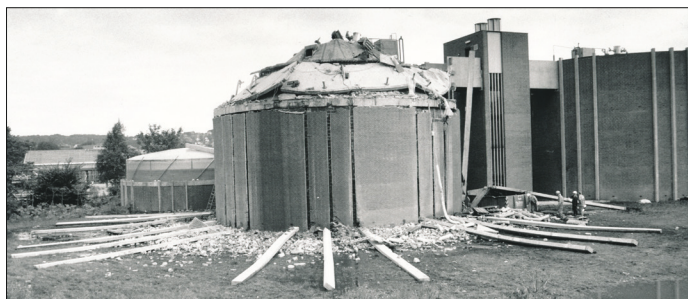
Pyntesøjler af beton var væltet bort fra tanken. En af betonsøjlerne hang meget usikkert mod trappetårnet. Bemærk rester af udluftningsslangen, der hænger ned fra taget, samt den intakte(?) identiske rådnetank til højre.

Løsningen var tagpap, altså svejsning ved brug af gasbrændere (åben ild).